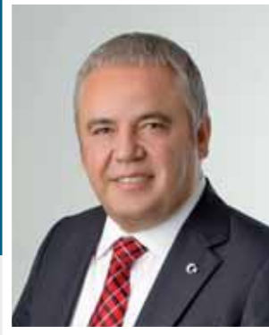
Muhittin Böcek Konyaaltı Belediye Başkanı Akdeniz Belediyeler Birliđi Başkanı