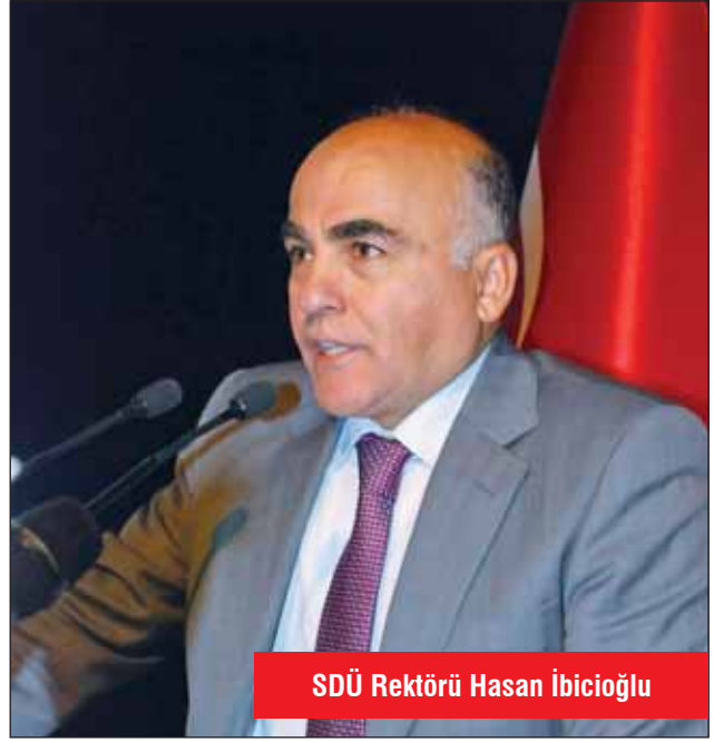
SDÜ Rektörü Hasan İbiciođlu

Tüm birim ve bölümleriyle üniversitenin deprem master planı yapmak için hazır olduğuna değinen SDÜ Rektörü Hasan İbiciođlu ise, “Isparta ülkemizde pek çok yerin olduğu gibi birinci derece deprem kuşağında. 1914 ve 1971 Burdur depremleri Isparta’da hasara ve yıkıma neden olmuştur. Isparta’da yeraltı oldukça hareketli. Son günlerde meydana gelen depremlerde yeraltının aktif olduğunu ortaya koymaktadır. O halde depremle yaşamak zorundayız. Isparta’da deprem zararların azaltmak amacıyla kamu otoriteleri ve mesleki kuruluşların yetkilileri tarafından ortaya konulmuş bir yol haritası bulunma-