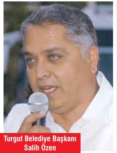
Turgut Belediye Başkanı Salih Özen

nin satın değil, alan belediye konumuna geldiğini açıkladı. Özen, "Belediye olarak eski ve kullanılmayan evleri sahiplerinden alarak evlerin yerine park ve bahçe düzenlemesi yapıyoruz. Amacımız Turgut'ta yeşil alan sayısını arttırmak. Bugüne kadar iki arsa ve bir evi satın alarak bu alanlarda yeşil alan düzenlemesine başladık. Hedefimiz, Turgut'ta kişi başına düşen yeşil alan sayısını arttırmak. Kullanılmayan eski evler yeşil alan olarak değerlendirilecek" dedi.