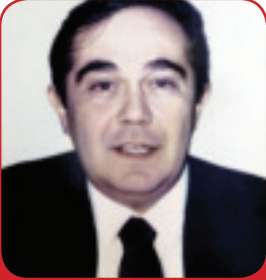
Av. Yener Ulusoy