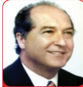
Av. Hasan Subaşı